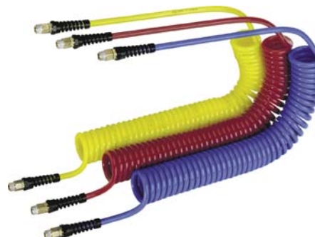
koncovky s vnějšími závity